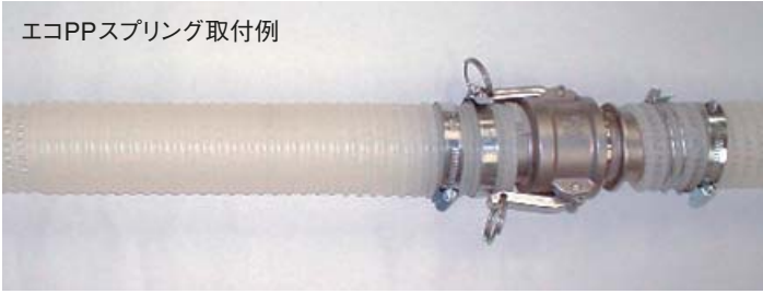
エコPPスプリング取付例